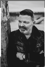
Peter Adler Portretfotograaf